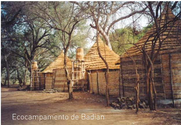
Ecocampamento de Badián

Nuestro sentido de la ayuda humanitaria no consiste en realizar un donativo económico o material. La ayuda es un intercambio, no un regalo. Nosotros aprendemos de ellos y ellos aprenden de nosotros. Ayudar es valorar la forma de vida ajena, aceptarla, y conjuntamente buscar alternativas para prosperar, sin ninguna imposición o afán de cambio. ■