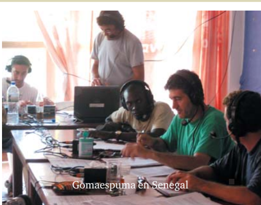
Gomaespuma en Senegal

Gracias a ellos, hay ahora un compromiso por parte del gobierno senegalés de legalizar a muchas ONG españolas que están actuando en Senegal. Gracias a Gomaespuma por darme esta experiencia tan bonita... gracias por la lección de profesionalismo.