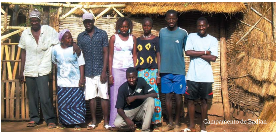
Campamento de Badián